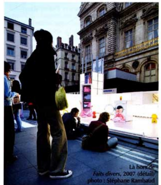
Là hors de Faits divers, 2007 (détail)

Sans être homogènes, ces huit installations tournent ainsi autour de la même question de l'urbain aujourd'hui, les points de vue et démarches à la fois éclatés et très ciblés de chaque intervention révélant aussi diverses facettes de l'histoire plus ou moins récente de la ville et de ses habitants au regard de l'art contemporain